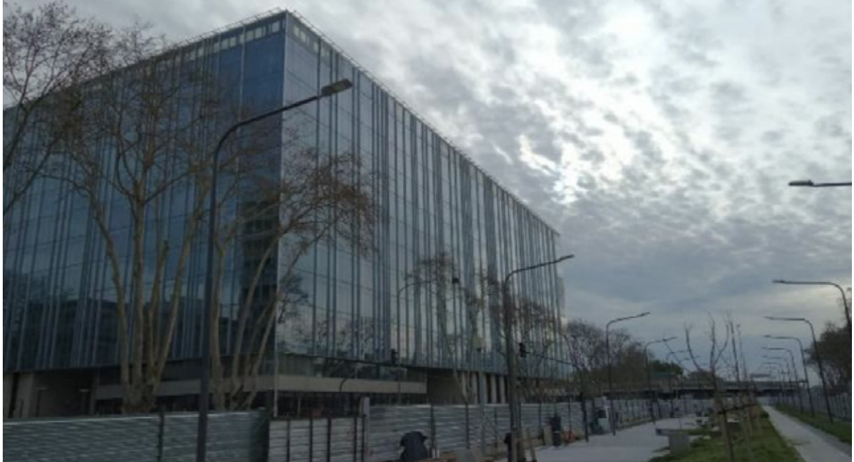
■ Vista exterior sobre Av. Ramón Castillo