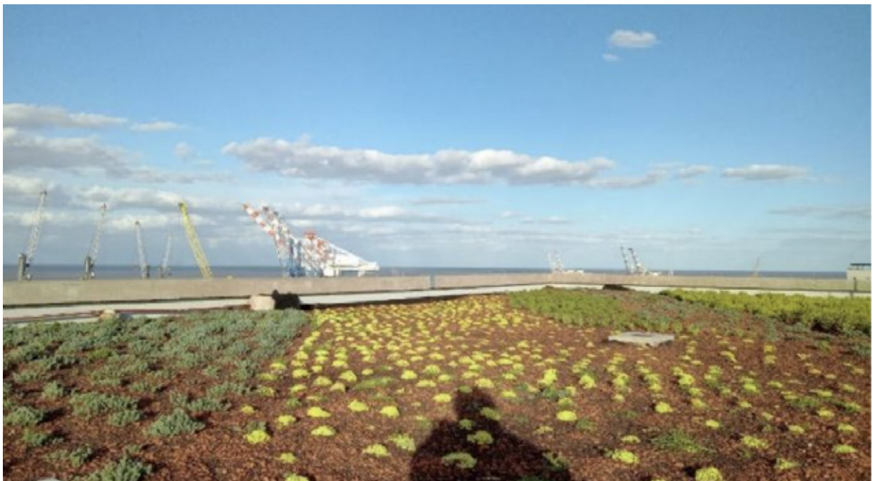
■ Parquización y riego – CUCULO