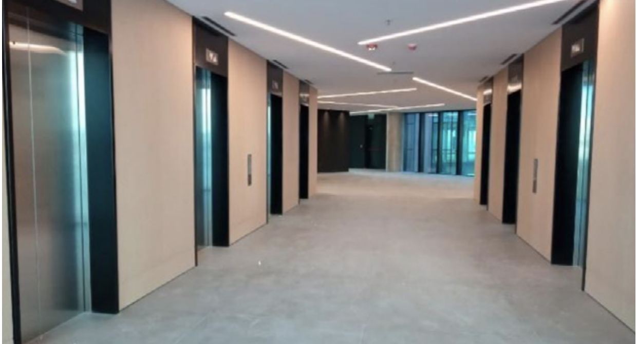
■ Montaje de revestimiento de madera – ARQYMAD