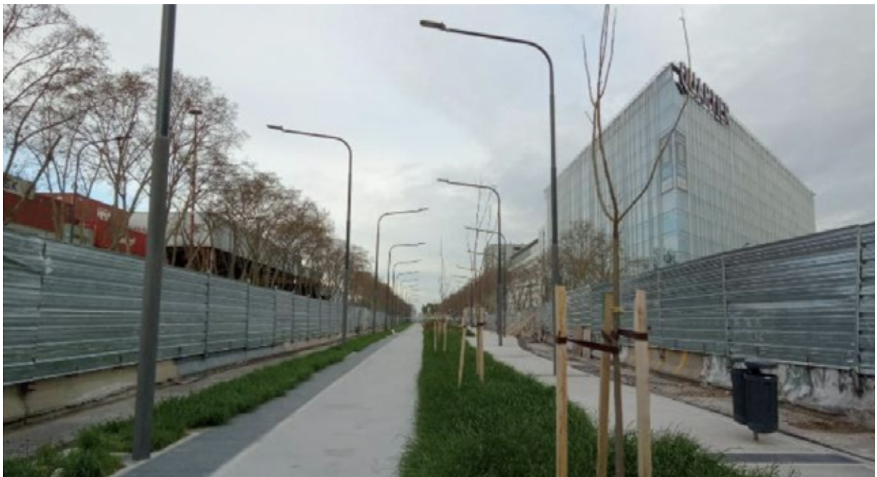
■ Paseo Castillo